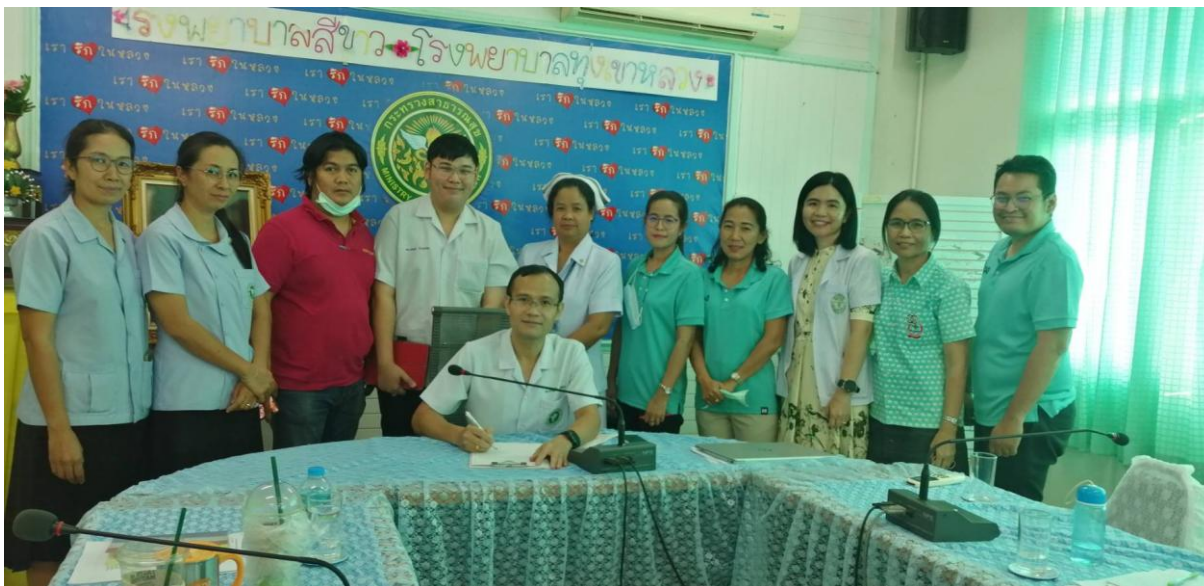
ภาพประกาศ....

- กำมือแนบอกข้างซ้ายตรงหัวใจ แสดงถึงการมี ใจดีรู้ (R:realise) ต่อปัญหาการทุจริต มุ่งมั่นไปสู่อนาคตข้างหน้า (O:onward) ในการแก้ปัญหาเพื่อความเจริญอย่างยั่งยืนของชาติ แสวงหาพัฒนาความรู้ (N:knoledge) ให้เท่าทันต่อสถานการณ์ และมี ความเอื้ออาทร (G:generosity) ต่อกันบนพื้นฐานของจริยธรรมและกฎหมาย สอดคล้องกับโมเดลประเทศไทยสู่ความมั่นคง มั่งคั่ง และยั่งยืน (Thailand ๔.๐)